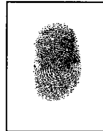
Huella Digital Índice Derecho