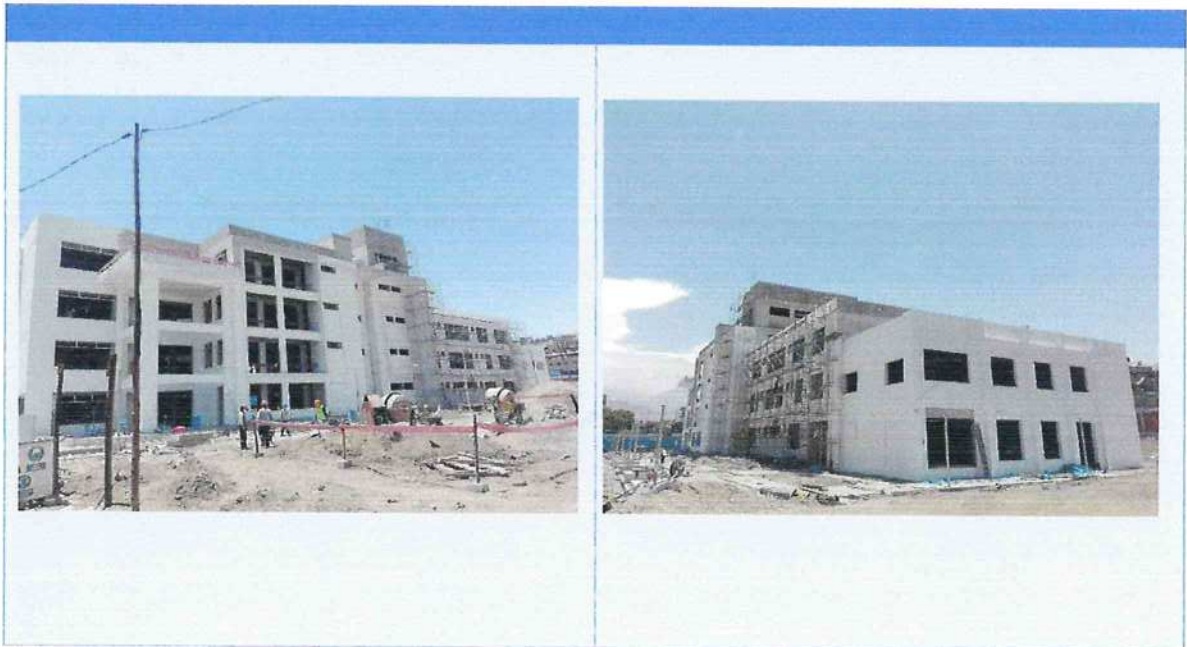
"CREACION DE LA INFRAESTRUCTURA E IMPLEMENTACION DE LA SEDE CENTRAL ADMINISTRATIVA DE LA UNIVERSIDAD NACIONAL DE MOQUEGUA, DISTRITO DE MOQUEGUA, PROVINCIA MARISCAL NIETO- MOQUEGUA".