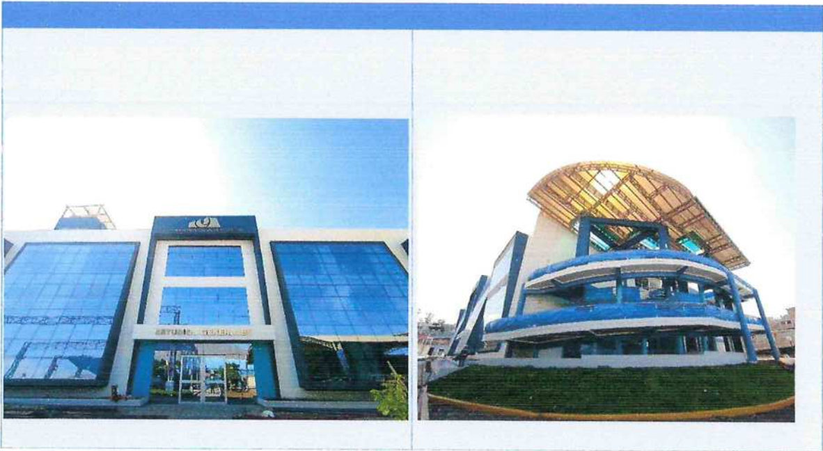
"MEJORAMIENTO DE LOS SERVICIOS DE ESTUDIOS GENERALES DE LA SEDE MOQUEGUA EN LA UNIVERSIDAD NACIONAL DE MOQUEGUA - DISTRITO DE MOQUEGUA - PROVINCIA DE MARISCAL NIETO - REGION MOQUEGUA".