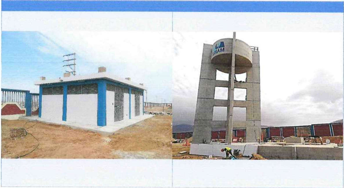
"CREACION DE LOS SERVICIOS BASICOS URBANISTICOS DE LA FILIAL ILO, PAMPA INALAMBRICA, DISTRITO ALGARROBAL, PROVINCIA DE ILO, DEPARTAMENTO DE MOQUEGUA".